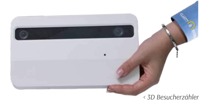
< 3D Besucherzähler

Kameraprozessor bereitgestellt, somit wird keine Rechenleistung von dem angeschlossenen Computer abverlangt. Zur Auswertung der Daten bei mehreren Ladenlokalen ist die Retail Statistics Software von CLARITY & SUCCESS erforderlich.