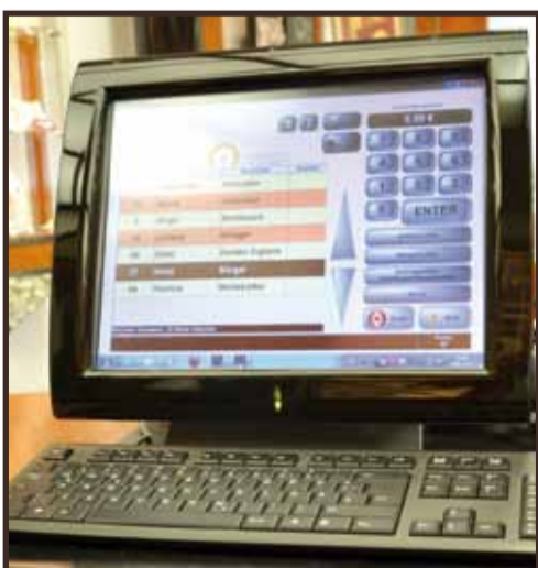
Bei der Installation wurde das System mit einem Update und neuen Zusatzfunktionen versehen.