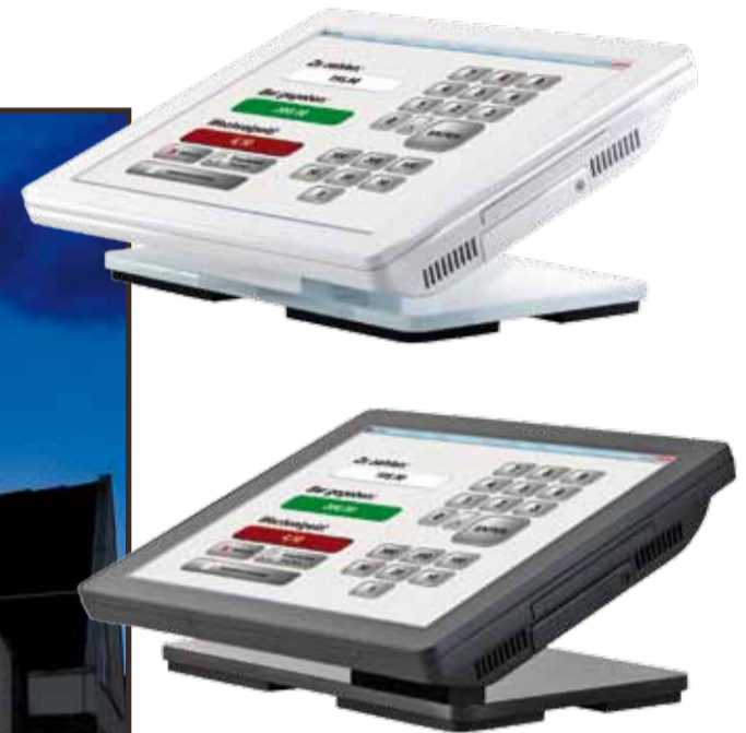
Durch unterschiedliche Designs lässt sich die Touchkasse dem Umfeld anpassen.

Seit über 40 Jahren ist Juwelier Hölscher in Nordhorn eine Adresse für ausgewählte Schmuck- und Uhrenmarken. Die Kunden des familiengeführten Geschäftes nahe der niederländischen Grenze schätzen nicht nur das ausgewählte Produktsortiment, sondern auch das besondere Ambiente des Geschäfts.