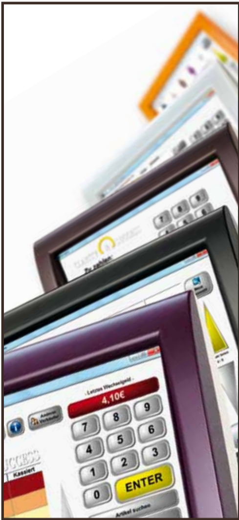
Intuitive Bedienbarkeit und gute Übersicht machen die Touchkasse von Clarity & Success zu einer Bereicherung im Service.