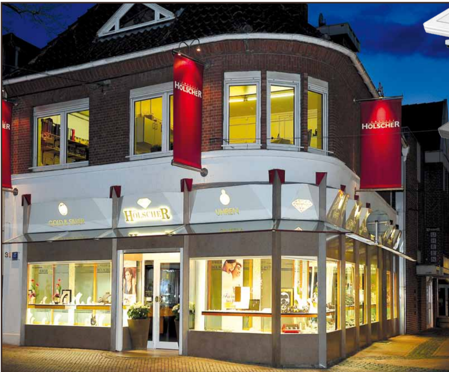
Zusammen mit Clarity & Success hat Juwelier Hölscher sein Warenwirtschaftssystem auf neuesten Stand gebracht.

Juwelier Hölscher hat das eigene Kassensystem optimieren lassen, um zukunftsgerecht ausgestattet zu sein. Der Softwarespezialist Clarity & Success hat mit einer neuen Touchkasse und weiteren Extras die Abläufe im Verkauf bewertet und dann verbessert.