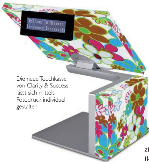
Die neue Touchkasse von Clarity & Success lässt sich mittels Fotodruck individuell gestalten

Schluss mit dem Einheitsbrei an gesichtslosen Kassensystemen, die im perfekt durchgestylten Laden wie Fremdkörper wirken. Clarity & Success, der Software-Spezialist für Juweliere, präsentiert nun die perfekt gestaltbare Hardware für den Tresen.