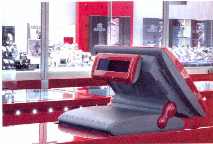
Touchkasse in der Farbe Carmine Red und mit Kundendisplay.